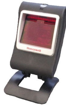
Genesis 7580g (stationär)

Denna kod gäller om du har en Windows-dator. Gäller endast stationära Genesis 7580g.