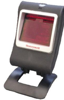
Genesis 7580g (stationär)

Denna kod gäller om du har en Windows-dator. Gäller endast stationära Genesis 7580g.