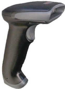
Hyperion 1300g (handhållen)